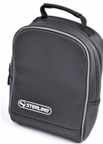
// SLC090241 Bolsa para batería