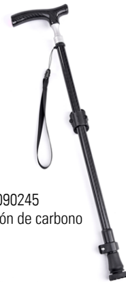
// SLC090245 Bastón de carbono