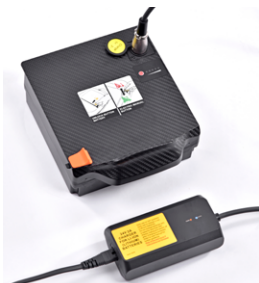
// SLC090246 Cargador adicional