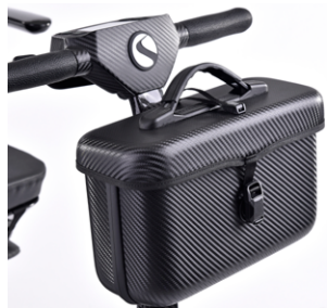
// SLC090239 Bolsa delantera