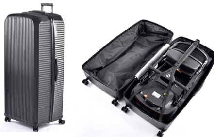
// SLC090244 Maleta rígida de viaje