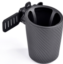
// SLC090243 Portavasos magnético