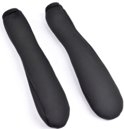
// SLC090242 Almohadillo acolchado para reposabrazos