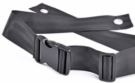
// SLC090269 Cinturón de seguridad