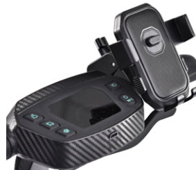
// SLC090206 Soporte para móvil