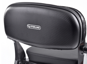
// SLC090240 Bolsa trasera