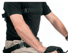
P3 - Soporte de respaldo y pélvico