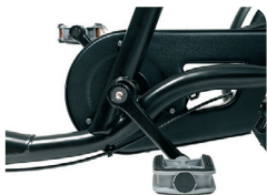
O1 + B1 - Piñón libre