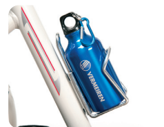
E7 - Soporte de bebida