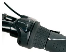
O3 - 3 marchas O7 - 7 marchas