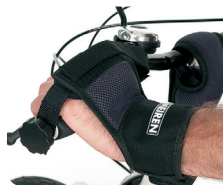
E10 - Fijación de mano con cinchas