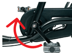
O2 - Freno con los pedales