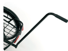
E1 - Barra de empuje (335 mm or 605 mm)