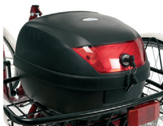
E5 - Baúl (30 litros)