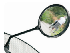
E8 - Espejo retrovisor