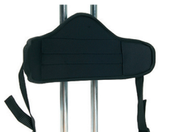
P1 - Soporte pélvico