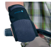
E11 - Fijación de mano