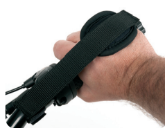
E9 - Cinchas de mano