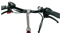
S2 - Manillar recto