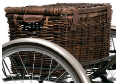
E4 - Cesta vintage