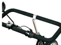
S4 - Manillar cerrado