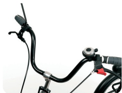
S1 - Manillar estándar