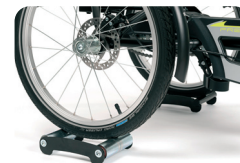
E13 - Función triciclo estático