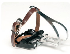
F2 - Pedales tipo ciclista