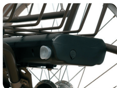
BAT 9 - Batería de repuesto 9A