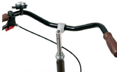
S3 - Manillar versión ciudad