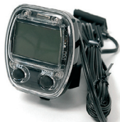
E3 - Cuentakilómetros