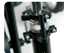
D1 - Sistema de bloqueo para manillar