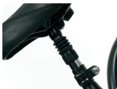
P5 - Tubo de sillín con amortiguador