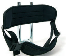
P2 - Soporte de respaldo