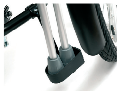
E6 - Soporte para muletas