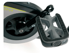
F5 - Pedales ajustables en longitud (22 mm)