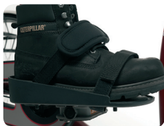
F3 - Pedales con sandalias