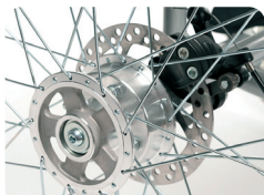
B1 - Freno de disco ruedas traseras