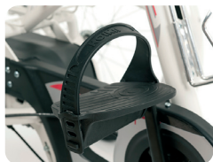
F1 - Pedales con fijación