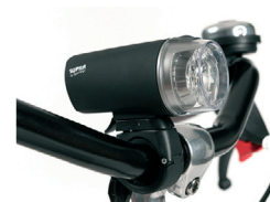
E2 - Luz delantera y trasera