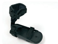
F4 - Pedales con fijación de tobillo