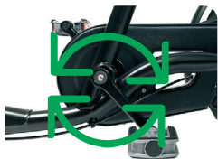
O6 - Piñón fijo