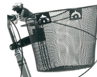
E14 - Cesta delantera