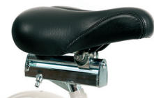
P4 - Sillín ajustable (140 mm)