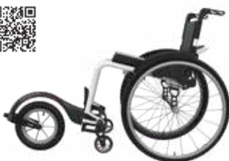
ICON 60 with TRACK WHEEL