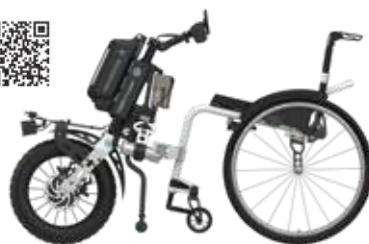
ICON 60 with PAWS