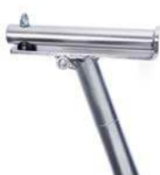
Soporte de sillín en forma de T