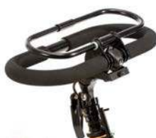
Manillar cerrado con sistema de freno