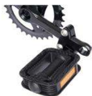
Reductor bielas pedales ajustable