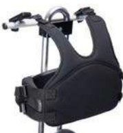
Chaleco de fijación