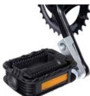
Reductor bielas pedales