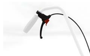
Freno acompañante para barra de empuje