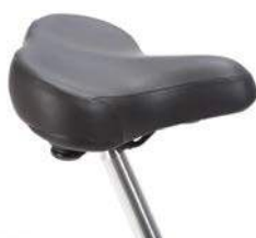
Sillín tipo ciclomotor