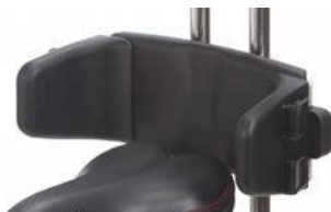
Control pélvico ajustable