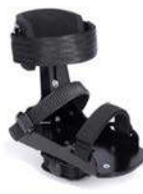
Pedales con soporte de tobillo