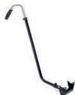
Barra de empuje