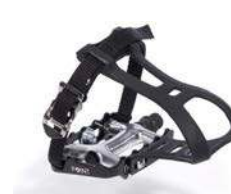
Pedales tipo ciclismo