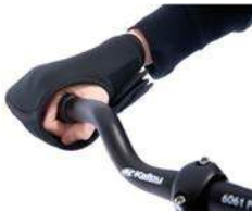
Fijación de mano