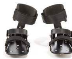
Pedales con soporte dinámico de tobillo