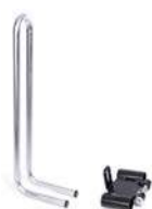
Barra del respaldo