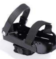
Pedales tipo sandalia