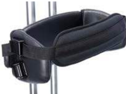
Cinturón de pecho