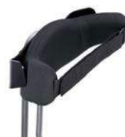
Control pélvico dinámico