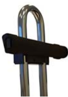
Barra universal para montar fijaciones