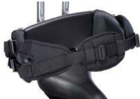
Cinturón de 4 puntos