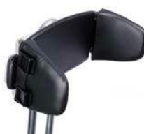
Respaldo ajustable en anchura