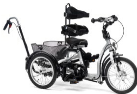
Barra de empuje direccional