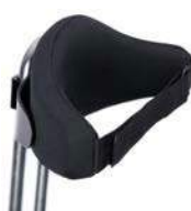
Respaldo dinámico con cinturón