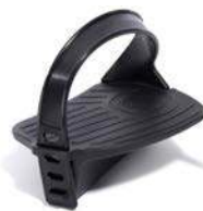
Pedales con fijación