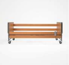
Slim Barandilla completa de madera de pino.