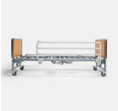
Verso HC Barandilla plegable de acero.