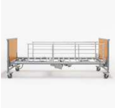
Scala 2 Barandilla de acero.