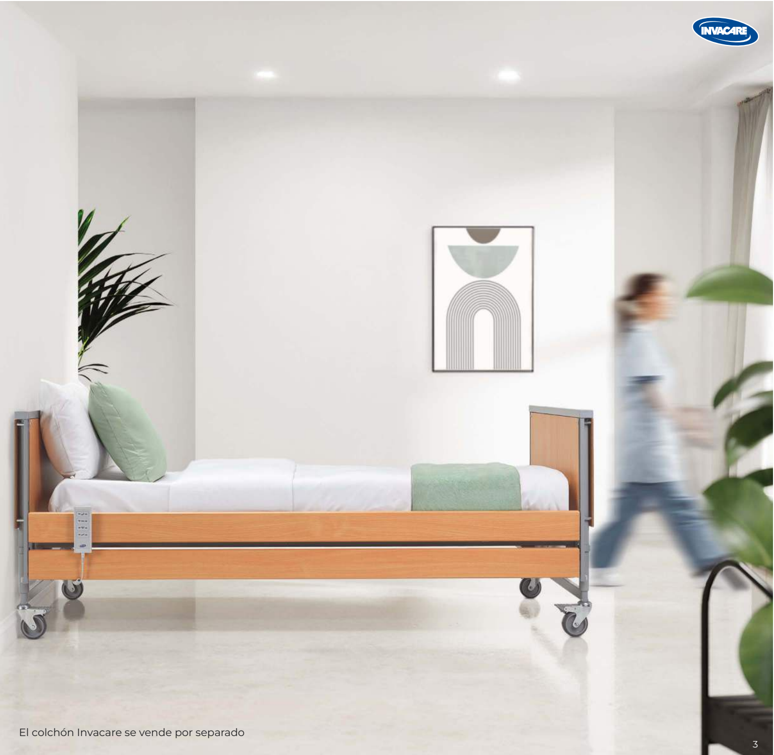
El colchón Invacare se vende por separado

Accent es una opción fácil y cómoda para pacientes, familiares y cuidadores.