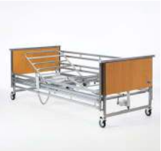
Aria Barandilla largo completo de metal.