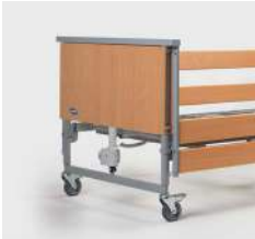
Cabeceros y pieceros Paneles embellecedores como opción.