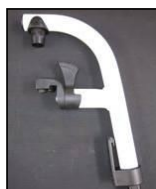
Reposapiés a 80^{\circ}