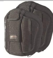
Torácico Medio (MT)