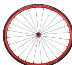
Carrete y llanta rojo anodizado