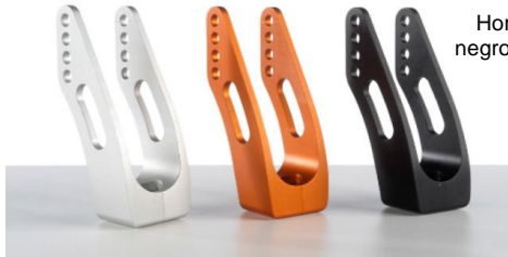
Horquilla de aluminio, negro, naranja o gris plata