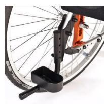
Tubo de cola con soporte de bastones