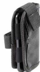
Soporte para el móvil