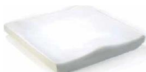
Cojín Jay Basic (imagen sin funda)