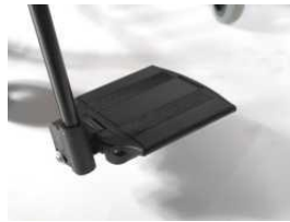
Plataformas individuales de aluminio