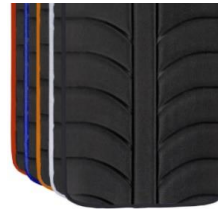
Colores ribetes tapicerías EXO EVO