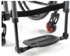
Plataforma única ligera abatible de composite