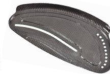
Protector de carbono con fender