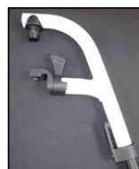
Reposapiés a 70^{\circ}