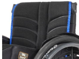
Tapicería de respaldo EXO EVO PRO