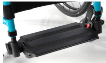
Plataforma única de aluminio, ajustable en ángulo con sistema de bloqueo