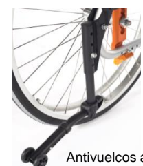
Antivuelcos abatibles ligeros