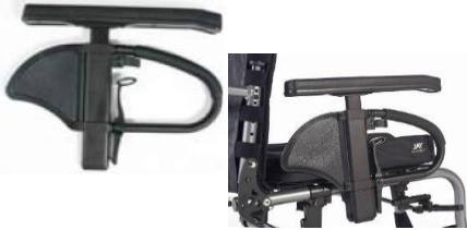
Reposabrazos ajustables en altura Quickie