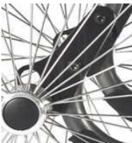
Eje para handbike