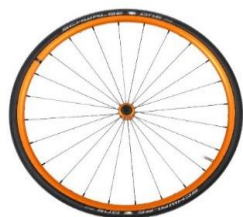
Carrete y llanta naranja anodizado