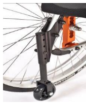
Ruedas de tránsito