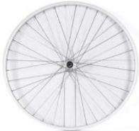
Ruedas con radios cruzados