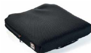
Cojín Jay Lite