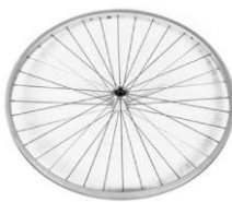
Ruedas de diseño