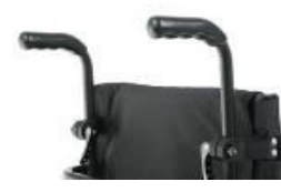
Empuñaduras ajustables en altura