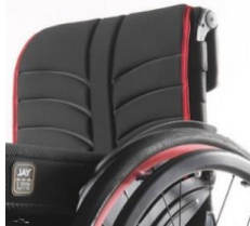
Tapicería de respaldo EXO EVO