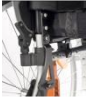
Respaldo ajustable en ángulo de -12^{\circ} a 8^{\circ}