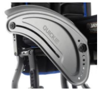
Protector de aluminio con fender