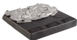
Cojín Jay Xtreme Active (imagen sin funda)