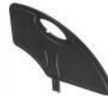
Protector lateral de composite