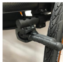
Freno Compacto EVO