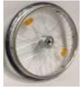
Ruedas con frenos de tambor