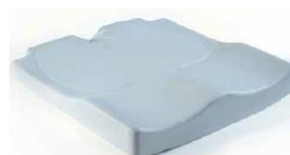
Cojín Jay Easy Visco (imagen sin funda)