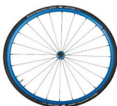
Carrete y llanta azul anodizado