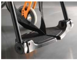
Plataformas individuales de composite