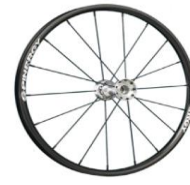
Ruedas Spinergy, 18 radios