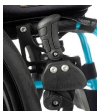
Freno de rodilla