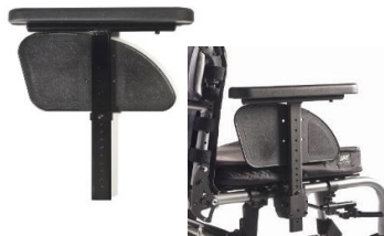
Reposabrazos ajustable en altura mediante herramientas