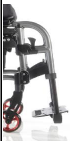
Reposapiés a 90^{\circ}