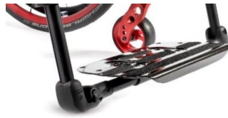
Plataforma única ligera abatible de carbono