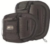
Torácico Inferior (LT)