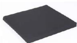
Cojín con funda negro