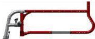
Armazón con reposapiés desmontables