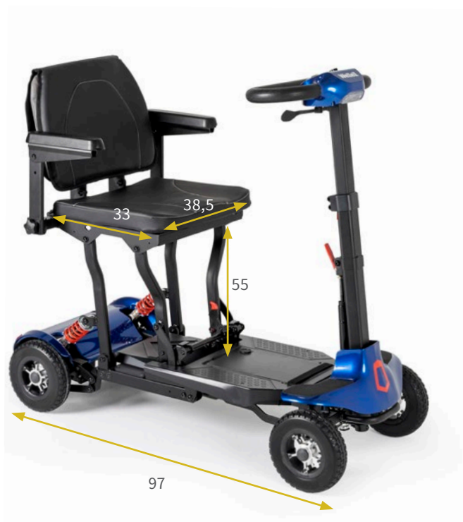
Medidas en cm