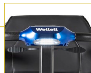
Luz LED delantera