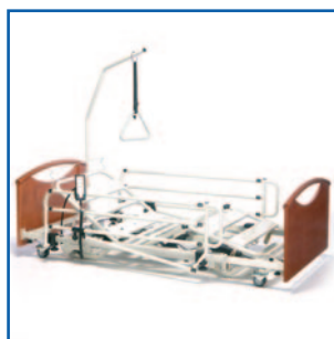
Posición más baja