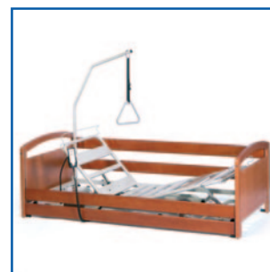
Con barandillas de madera (opcional)