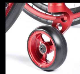
Horquilla de aluminio de 1 solo brazo

¡Descubre el configurador online para diseñar la QUICKIE Nitrum de tus sueños!