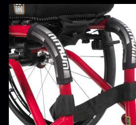
Protector de armazón