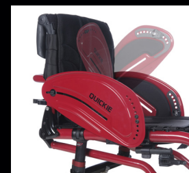
Protector de aluminio abatible