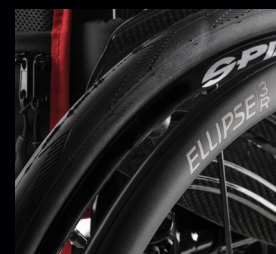
Aros Ellipse 3R, color negro