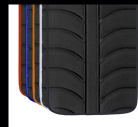
Tapicería de respaldo EXO PRO