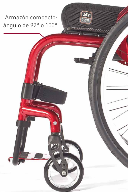
> Diseño innovador del armazón frontal . Moderno y con una gran resistencia.