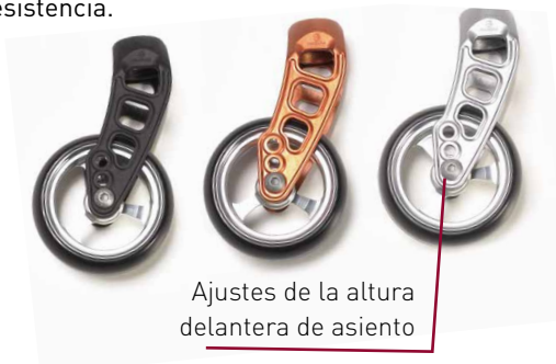
Ajustes de la altura delantera de asiento

La búsqueda de nuevos materiales y tecnologías ha sido clave en el desarrollo de la Argon 2 . El material utilizado en las horquillas es Carbotecture - un material de fibra de carbono extremadamente fuerte y ligero, con una gran resistencia a los impactos. El diseño curvado del tubo de la horquilla se ha conseguido mediante la técnica del Hydroforming , que permite obtener geometrías complejas del tubo con la mayor resistencia.