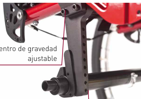
Ajustes de la altura de asiento trasera y del ángulo de asiento