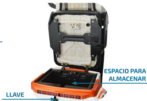
Caja de almacenamiento debajo de la silla