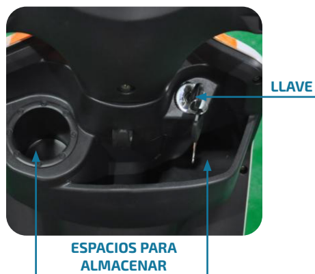
Caja de almacenamiento frontal

Hay dos pequeñas cajas de almacenamiento para guardar algunos artículos pequeños.