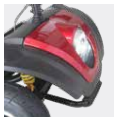
Luz led delantera