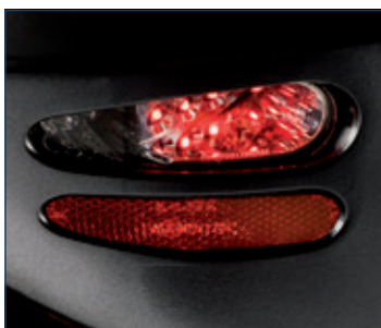
Luces de posición y frenado

Gracias a su avanzada tecnología de iluminación LED de bajo consumo, las luces de los scooters Serie-S son 400 veces más eficientes que las bombillas normales, lo que se traduce en un mayor ahorro de energía en la batería y por tanto una mayor autonomía de viaje. Así podrás disfrutar de tu scooter por más tiempo.