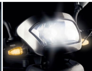
Luces delanteras e intermitentes