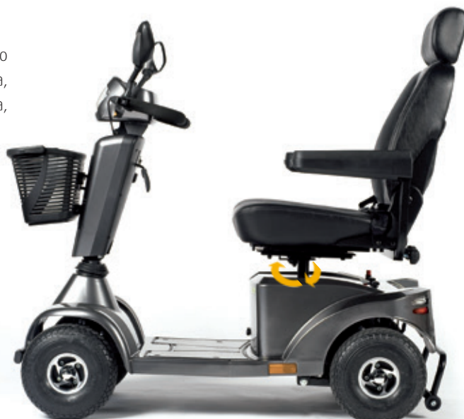
Asiento giratorio que hace más cómodas las transferencias