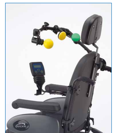
Mando mentoniano con doble pulsador y pantalla Omni + [opcional].