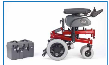
Estructura plegable, respaldo desmontable y baterías extraíbles.

Además, los antivuelcos se pliegan cuando hacen tope contra un obstáculo, por lo que la longitud de la silla se ve reducida en 5 cm. Esto es especialmente útil para tener cabida en ascensores. Y es muy robusta .