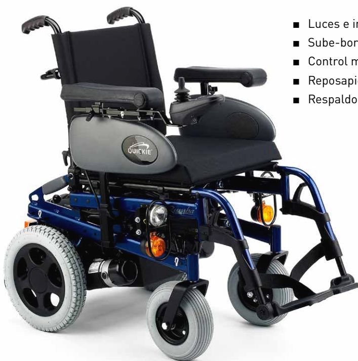
Luces e indicadores para una conducción más segura [opcional]