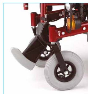
Sube-bordillos [opcional] para superar obstáculos de hasta 10 cm.