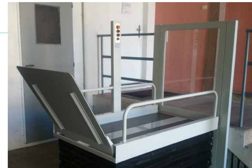
Puerta en la parada superior con cerradura eléctrica (opcional).