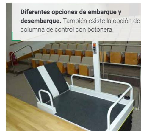
Diferentes opciones de embarque y desembarque. También existe la opción de columna de control con botonera.