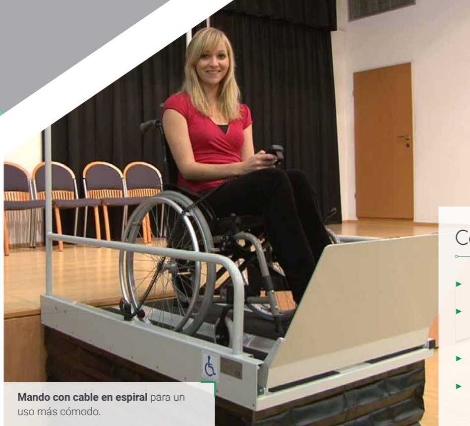
Mando con cable en espiral para un uso más cómodo.

Plazo de entrega inmediato para el modelo estándar