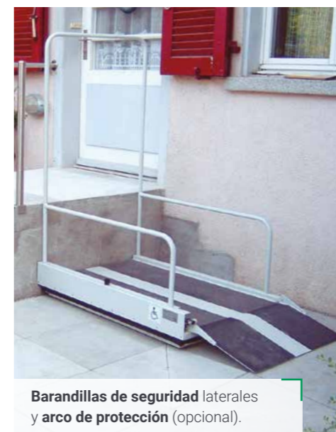
Barandillas de seguridad laterales y arco de protección (opcional).