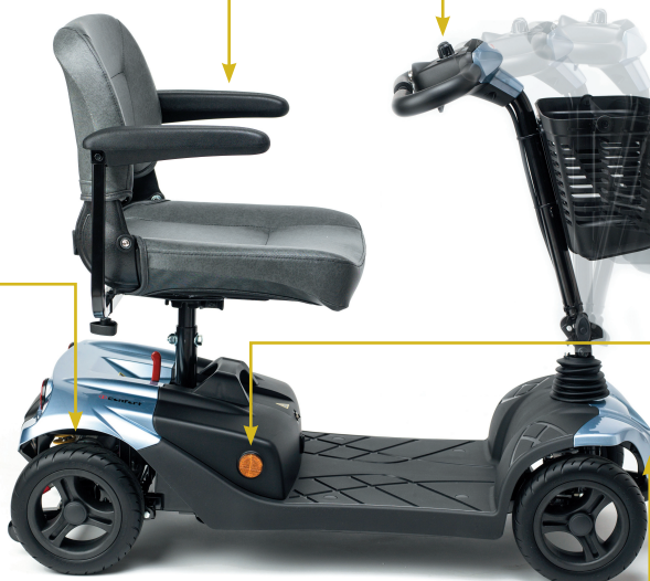
Columna de conducción