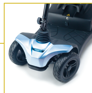
Luz led delantera