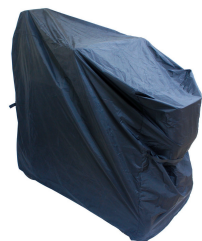
Funda de almacenaje