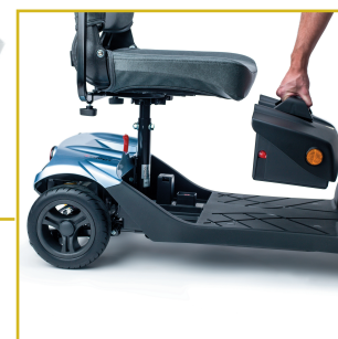
Baterías extraíbles para facilitar su recarga