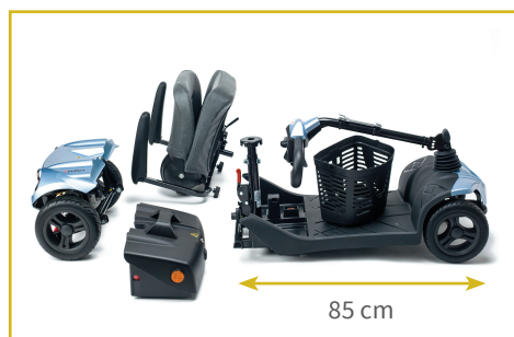
Desmontable en 4 piezas