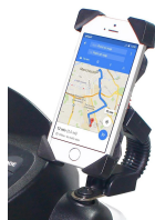
Soporte para móvil