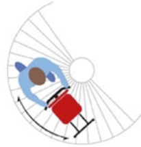
Scala chiocciola / Spiral staircase