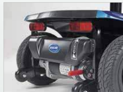
Iluminación de alta calidad