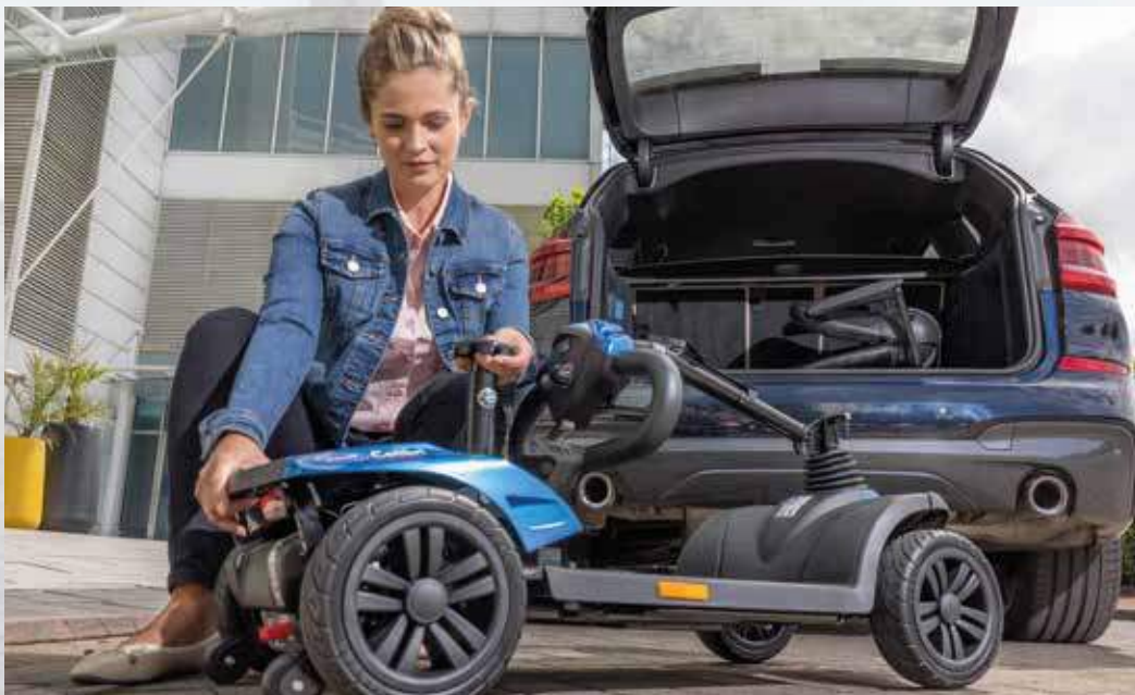
Fácil de transportar gracias al sistema Litelock™