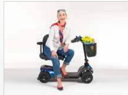
Asiento giratorio para transferencias más fáciles