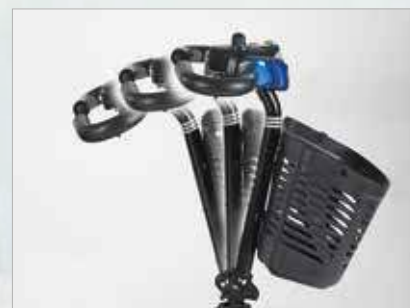
Manillar ajustable para mejorar la posición de conducción