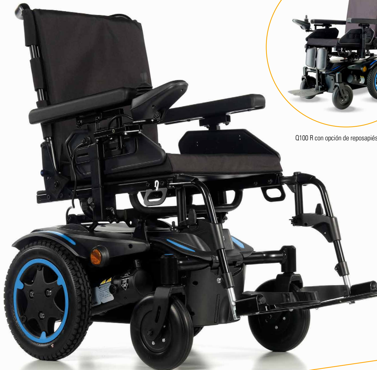
Q100 R con opción de reposapiés centrales