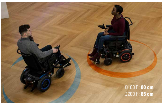
Q100 R: 80 cm Q200 R: 85 cm

Muévete como quieras con la Q100 R y Q200 R gracias a su radio de giro ultra reducido. Podrás girar sin esfuerzo en pasillos angostos, cocinas u otros espacios estrechos sin la necesidad de realizar maniobras complicadas.